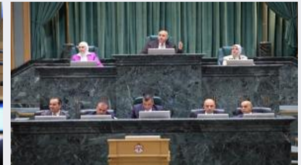
مجلس النواب يُقر 9 مواد جديدة بمشروع قانون...