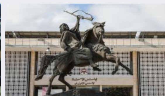
الأعيان يقر مشروع قانون عقود التأمين...