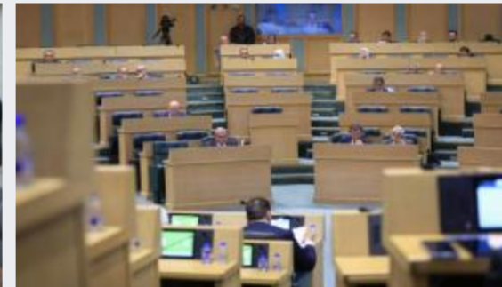
مجلس النواب يواصل اليوم مناقشة مشروع قانون...