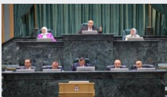
النواب يواصلون مناقشة مشروع قانون التربية...