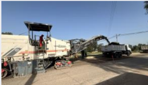
واقع القراءة في الأردن على طاولة ثقافة... أخبار الأردن