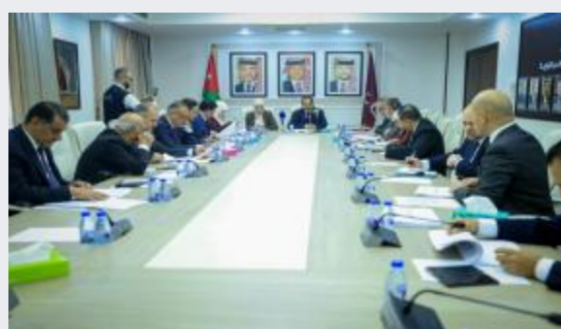
القانونية النيابية تبحث معدل الملكية العقارية