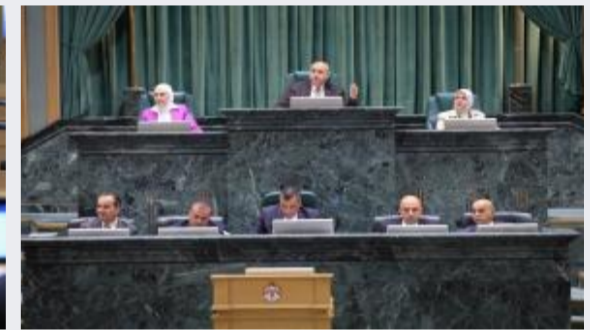
مجلس النواب يُقر 9 مواد جديدة بمشروع قانون...