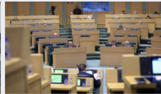
مجلس النواب يواصل اليوم مناقشة مشروع قانون...