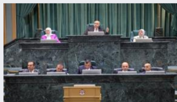
النواب يواصلون مناقشة مشروع قانون التربية...