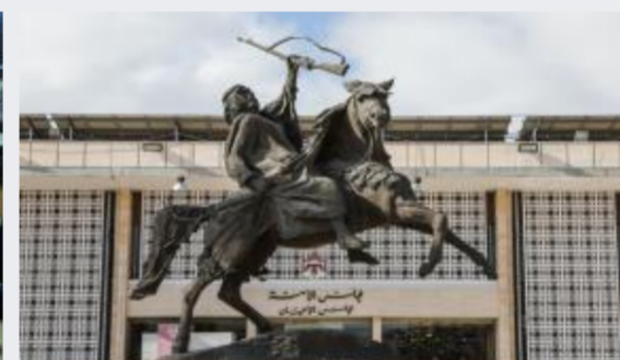
الأعيان يقر مشروع قانون عقود التأمين...