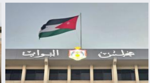
مجلس النواب يناقش المادة 3 من مشروع...