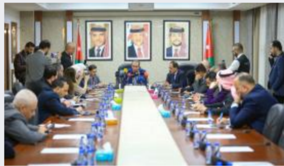
الطراونة: تعديلات الضمان الحالية غير...