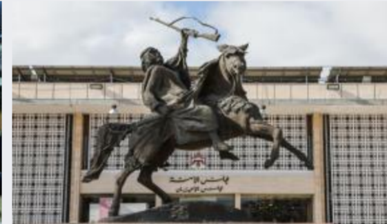
الأعيان يقر مشروع قانون عقود التأمين...