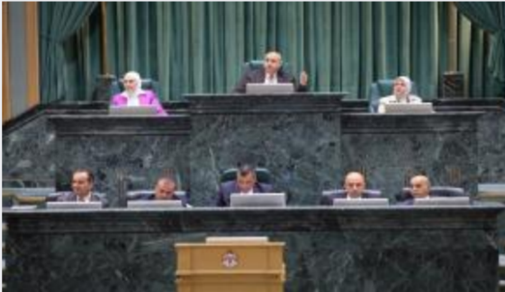
النواب يواصلون مناقشة مشروع قانون التربية...