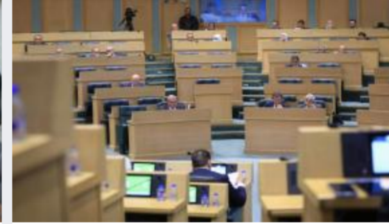
مجلس النواب يواصل اليوم مناقشة مشروع قانون...