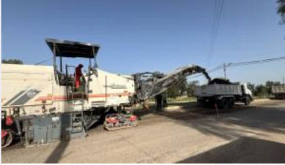
واقع القراءة في الأردن على طاولة ثقافة...