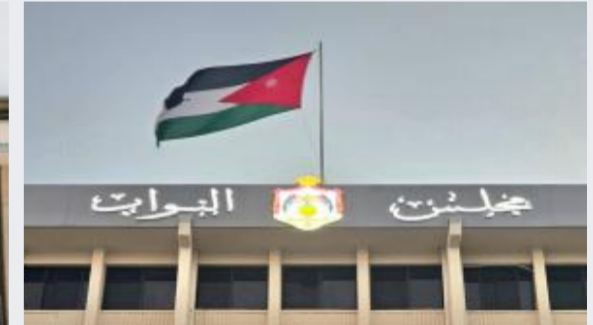
مجلس النواب يناقش المادة 3 من مشروع...