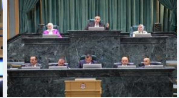
مجلس النواب يُقر 9 مواد جديدة بمشروع قانون...