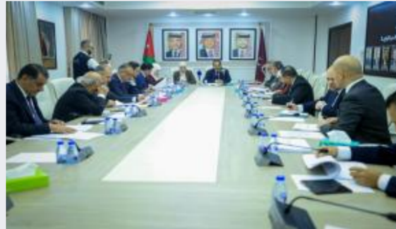
القانونية النيابية تبحث معدل الملكية العقارية