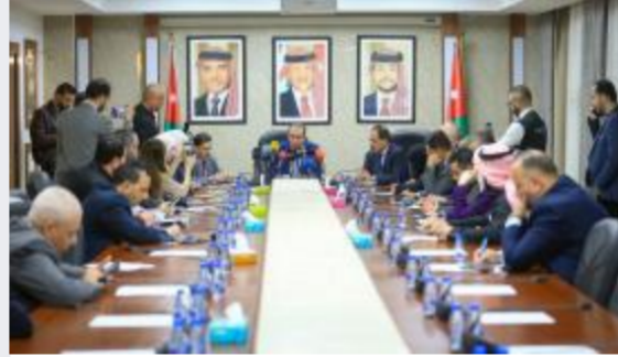
الطراونة: تعديلات الضمان الحالية غير...