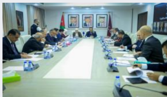
القانونية النيابية تبحث معدل الملكية العقارية