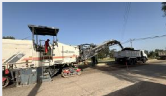
واقف القراءة في الأردن على طاولة ثقافة...