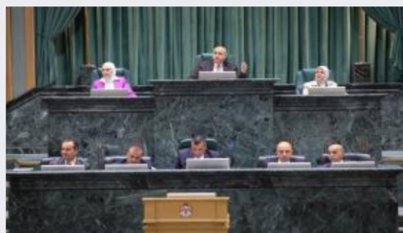
النواب يواصلون مناقشة مشروع قانون التربية...