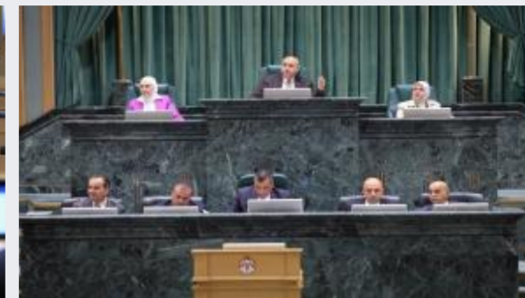
مجلس النواب يُقر 9 مواد جديدة بمشروع قانون...