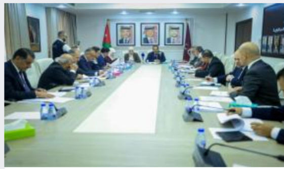
القانونية النيابية تبحث معدل الملكية العقارية