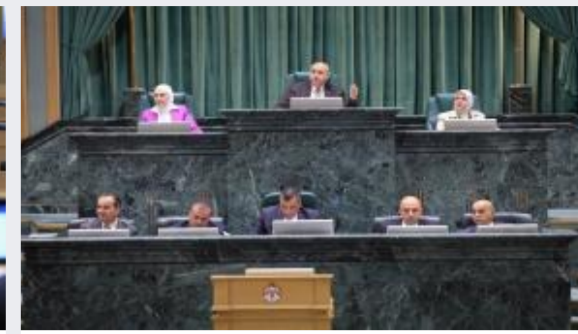
مجلس النواب يُقر 9 مواد جديدة بمشروع قانون...