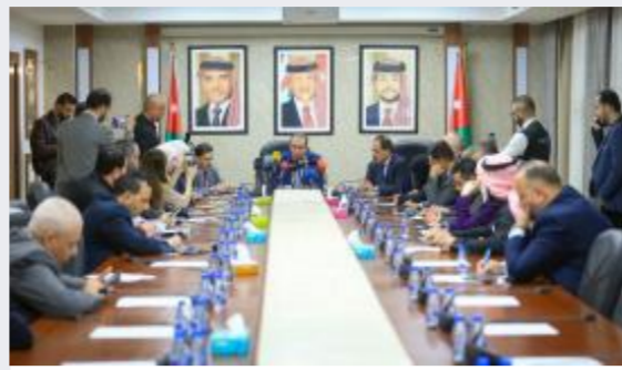
الطراونة: تعديلات الضمان الحالية غير...