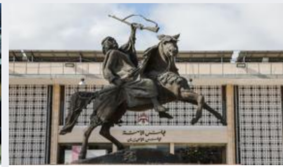
الأعيان يقر مشروع قانون عقود التأمين...