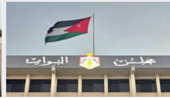
مجلس النواب يناقش المادة 3 من مشروع...