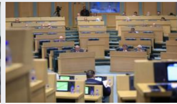
مجلس النواب يواصل اليوم مناقشة مشروع قانون...