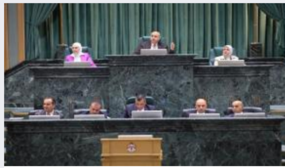
النواب يواصلون مناقشة مشروع قانون التربية...